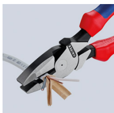
Продольное резание для разделения плоских кабелей